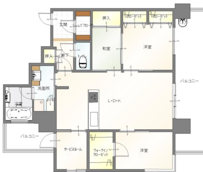
【現況を優先します】