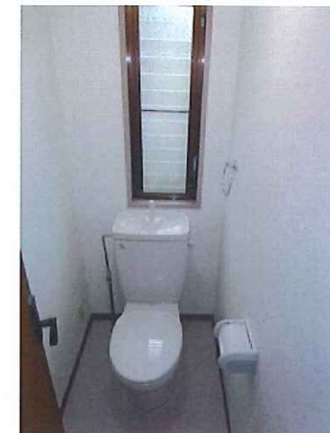
シューズボックス