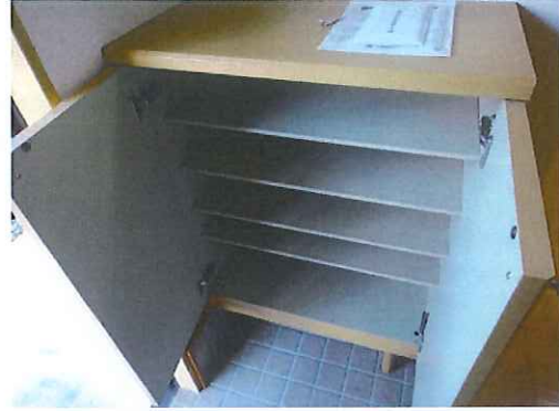
シューズボックス