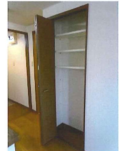
キッチンクローゼット