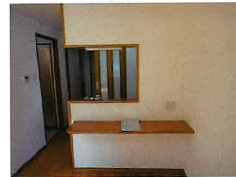
キッチンカウンター