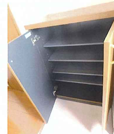
シューズボックス