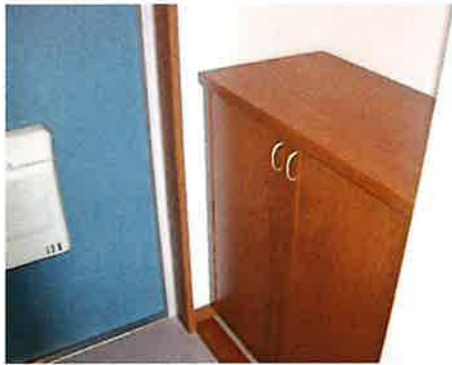
シューズボックス