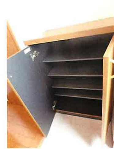
シューズボックス