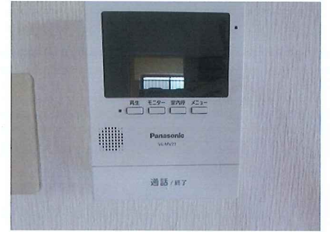
モニター付きインターホン