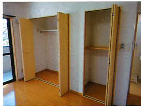
クローゼット・収納