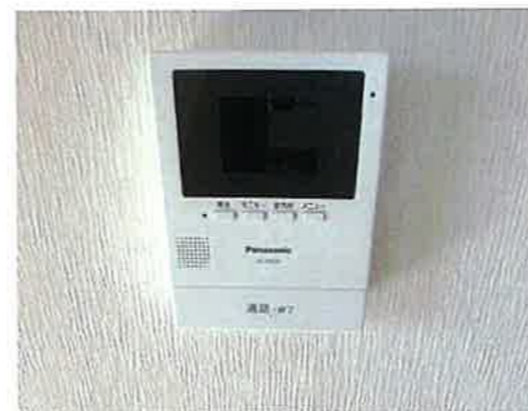
モニター付きインターホン