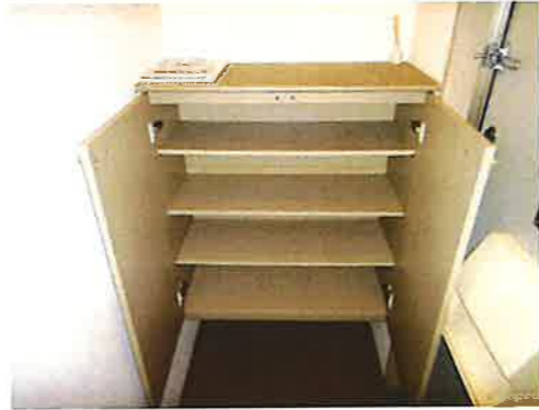
シューズボックス