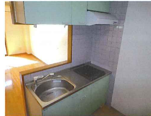
キッチンカウンター