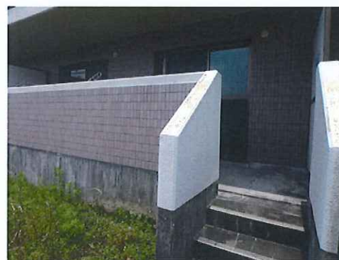
ベランダ・専用庭