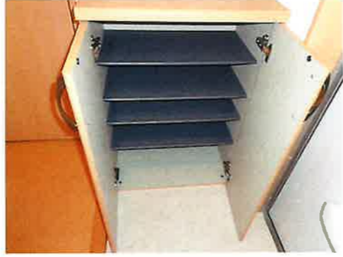
シューズボックス