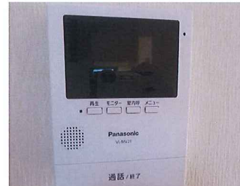
モニター付きインターホン