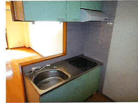
キッチンカウンター