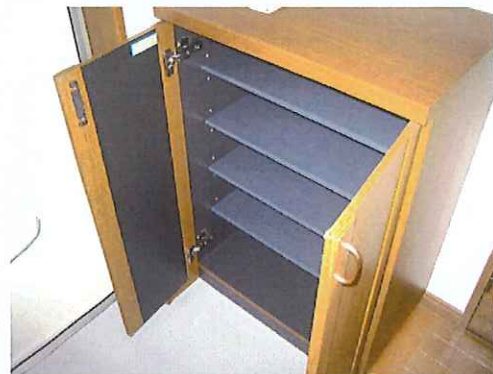
シューズボックス