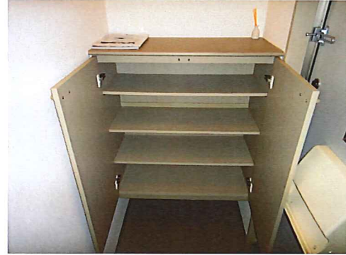
シューズボックス