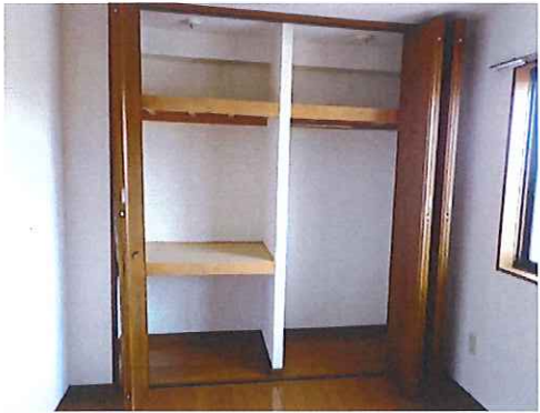
洋室クローゼット