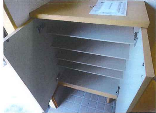
シューズボックス