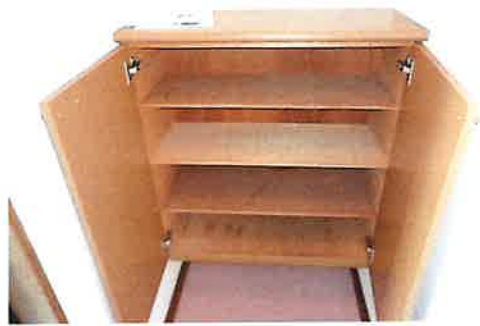
シューズボックス