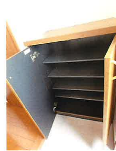
シューズボックス