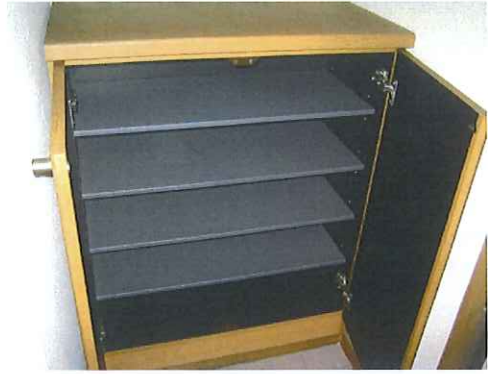
シューズボックス