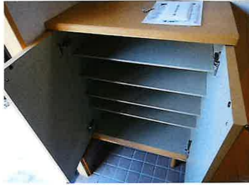
シューズボックス