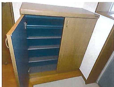
シューズボックス